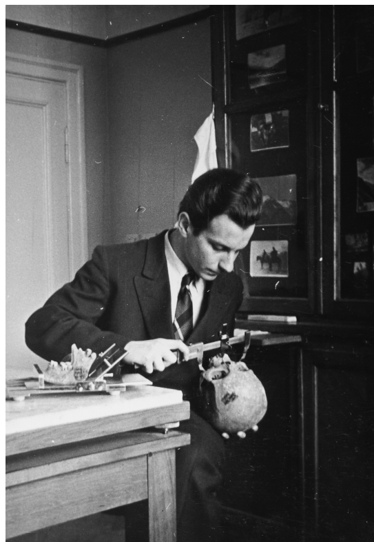
На кафедре антропологии МГУ