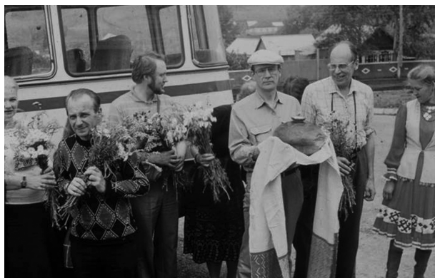
Участники Советско-финляндской экспедиции в Башкирию, 1983

(Odontoglyphics. IX Int. Cngr. Of Anthrpologists and Ethnologists. Chicago. 1973; Одонтоглифика // Раскогнетические процессы в этнической истории», М., 1974). Признаки одонтоглифики введены во все версии программы по изучению морфологии зубов.