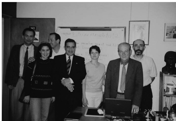
Группа участников Международного семинара по методическим проблемам антропологии и археологии в Национальном университете Колумбии, Богота, 1997 г.