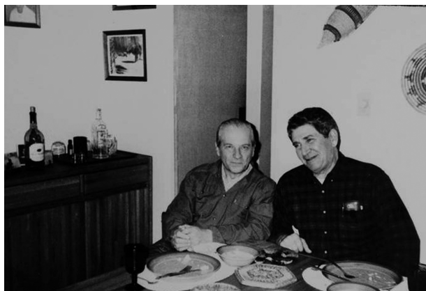
Обсуждение с профессором С. Молнером (Сент-Луис, США) проблем антропологии, 1993 г.

предшественников человека, первых гоминид, первых представителей человечества, анализируются представления о систематике древних гоминид стадии Homo erectus/ergaster , обосновываются новые подходы к таксону Homo heidelbergensis .